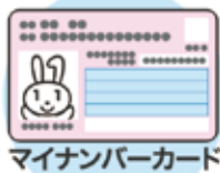
マイナンバーカード